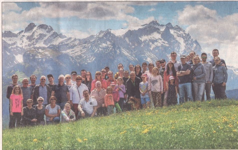
Die 34 Teilnehmer des Partnerstätteturniers aus Sindelfingen und Dronfield mit ihren Gastgebern vor der grandiosen Alpenkulisse des 2502 Meter hohen Säntis

nach Luzern, wo die Teilnehmer in einer Schokoladenmanufaktur ihre eigene Tafel Schokolade kreieren konnten. Anschließend führte der Weg in die Innenstadt von Luzern, wo gerade der Stadtlauf mit über 15 000 Läufern stattfand.